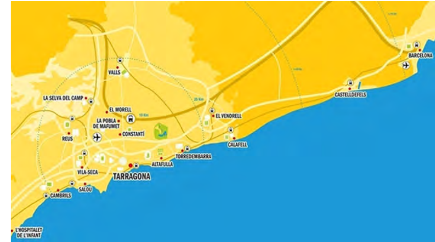
Els Jocs Mediterranis Tarragona 2017, un Jocs del territori

Aquest document marca la finalització del procés de planificació estratègica del llegat i ha de ser el full de ruta que ha de servir al territori de base per posar els Jocs Mediterranis al servei del territori , integrant els Jocs en els projectes i les polítiques del territori per que actuïn com a catalitzador aprofitant el momentum de l'esdeveniment i contribueixin als projectes de desenvolupament local .